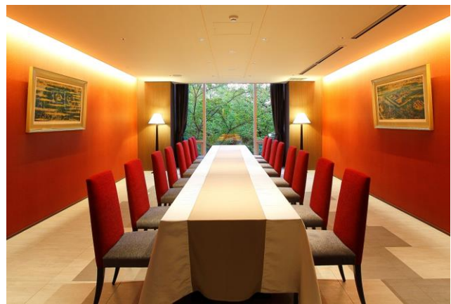
個室「蘭の間」(8~16名さま用)