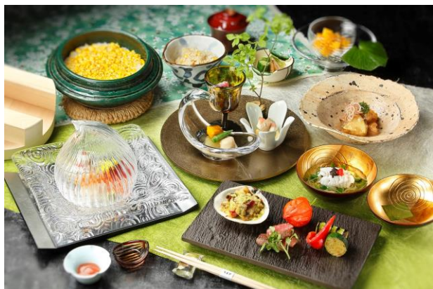
「開業記念ミニ懐石」イメージ (昼食限定)