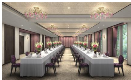
■ 右上：ザ・プリンス さくらタワー東京 外観 真ん中上：和食「茶屋小路」、真ん中下：Banquet Room「Rose Garden(ローズガーデン)」 左上：寿司「朝陽(あさひ)」、左下：Bar ラウンジ「Sa.Ku.Ra.(さくら)」