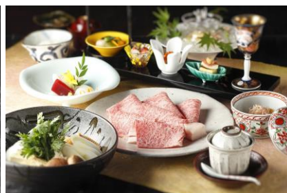
「すき焼コース」イメージ