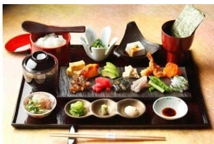
「手巻きちらし」イメージ