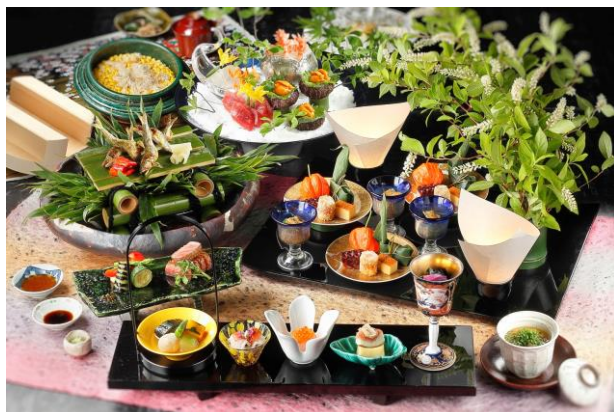
「開業記念懐石」イメージ

1830年の創業より受け継がれてきた伝統的な日本料理のほかに、交通やビジネスの拠点として発展を続けている高輪・品川エリアに訪れる海外からのお客様へむけて、なだ万 高輪プライム限定メニューの「手巻きちらし」をはじめ、すき焼、しゃぶしゃぶ、寿司、天婦羅、蕎麦など海外の方にも人気の料理を多数用意しています。寿司カウンターでは目の前で職人が握る本格的な寿司が楽しめます。